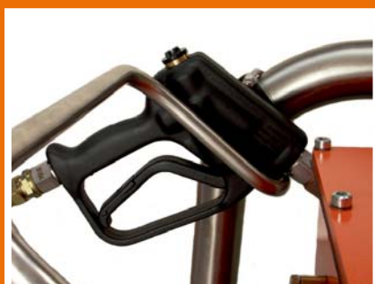
Robuster Edelstahl Rohrrahmen mit Lanzenhalter.