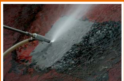
Strahlbild Wasser- Sandstrahlkit.