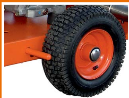
Feuerverzinkter Grundrahmen mit Luftreifen.