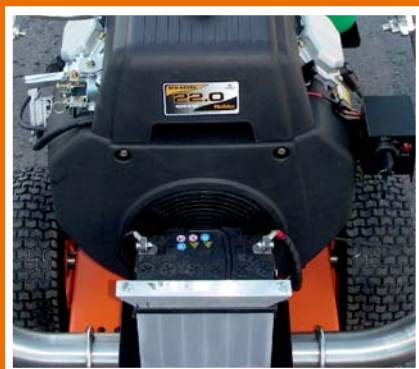
2 Zylinder 4 Takt V- Motor, Robin Subaru, mit Elektrostart.