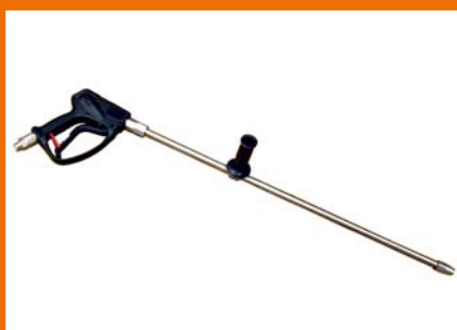
Spritzeinrichtung mit seitlichem Stützgriff.