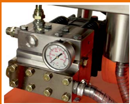
Edelstahl- Pumpenkopf mit integriertem Ventilblock (500 Bar).